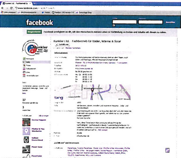
SHK-Profi Kunkler aus Münster-Sarmsheim gibt unter Facebook ein aussagekräftiges Firmenprofil ab.

Bei der Ende Juni gestarteten Alternative werden Nutzer standardmäßig aufgefordert, ihre Kontakte zu „Kreisen“ hinzuzufügen. Stellen Nutzer Inhalte ein, müssen sie auswählen, welchen Kreisen dies zugänglich gemacht wird. Für diese einfache, dem Datenschutz dienende Implementierung hat der Neuankömmling viel Lob bekommen – und binnen kürzester Zeit mehrere Millionen Mitglieder eingesammelt. Über eine Browser-Erweiterung lassen sich Google+ und Facebook ansatzweise verbinden. Das Plugin für Firefox oder Chrome fügt der Google+-Oberfläche einen zusätzlichen Button hinzu, über den der eigene Facebook-Nachrichtenstream angezeigt wird. Im Direktvergleich gibt es für drei