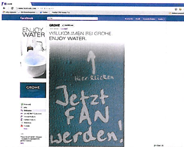
ARGE-Mitglied Grohe bringt es auf den Punkt: Unternehmen kommunizieren bei Facebook über sogenannte „Fanseiten“.