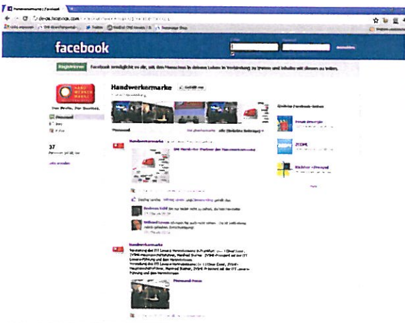
Ebenfalls mit Social Media vertraut: www.handwerkermark.de.