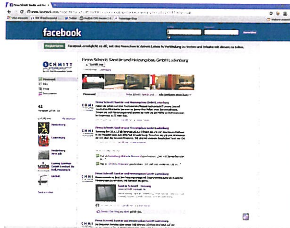
Die Schmitt Sanitär und Heizungsbau Ludenburg lädt u. a. auf ihrer Fanseite zu Informationsveranstaltungen ein.

Media in Anspruch nimmt, muss auch mit ihren Nachteilen leben. Wichtig ist es, die Balance zu halten. Das gilt sowohl für das Internet als auch für das reale Leben.“